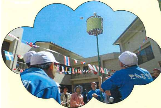
青空の下で気持ち良かったです