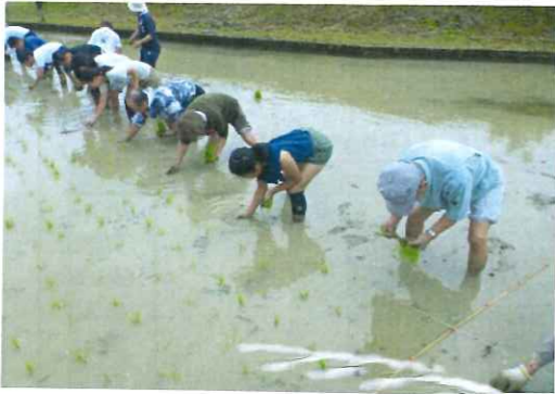
ぬかるみに足を取られて大変でした

6月8日曇り空の下、近隣の久米小学校の生徒さんたちと一緒に田植えをしました。田んぼの中は足元が悪く、ぬかるみに入った足がなかなか抜けずに苦労しました。美味しいお米になるように一本一本丁寧に植えました。一生懸命、小学生と一緒に汗をかいた後に、久米婦人会のみなさんが、はがまで炊いたもち米を使って作った「はがま餅」をいただきました。