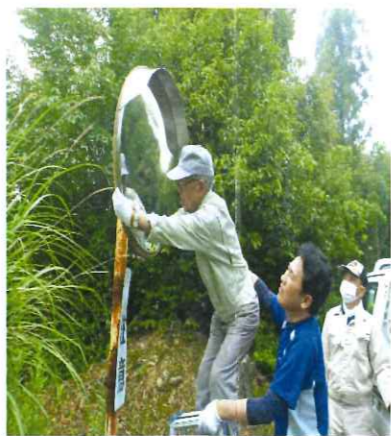
見通しの良いミラーになりました

交通安全週間の4月13日に、大洲交通安全協会肱南支部の4名の皆様のご協力をいただき高山方面20箇所のカーブミラーを清掃しました。みなさん熱心に掃除されとてもきれいになりました。