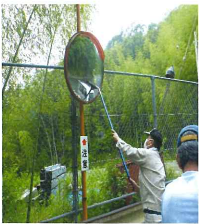
安全運転をお願いします