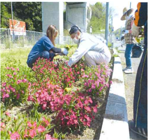
きれいな道作りに一役かっています!

オレンジロードとは南予56号「ボラソニア・サポート・プログラム」の愛称です。地域の人と共に快適な道作りに協力しています。平成21年4月1日から活動を続けた成果が認められ、この度「国土交通行政関係功労者表彰」をいただけることになりました。これからもオレンジロードの活動を楽しく頑張っていきます。