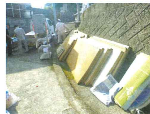
浸水した集会所の掃除に行きました

西日本に甚大な被害をもたらした記録的大雨で、大洲市においては、大洲市におおきな被害がもたらされ、今も復興作業を強いられる被災者の方がたくさんおられます。当園は幸いにも被害を免れましたが、こうした状況に鑑みて、8月7日に予定しておりました納涼大会を中止することをお知らせいたします。