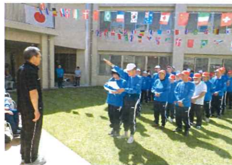
赤組も白組も頑張りました

5月15日、大洲幸楽園の中庭で運動会を行いました。心配された天気も、晴天に恵まれての開催です。ケガの無いように十分にラジオ体操を行って、初めに行うプログラムは玉入れです。両組ともたくさん玉を入れましたが、赤組の方が多く、今年も赤組に軍配が上がりました。その後、栗拾いゲームや、魚釣りゲームやパン食い競争など、おもいっきり体を動かしました。