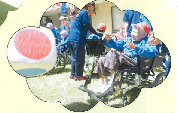
サイコロの目はなにができるでしょう!?