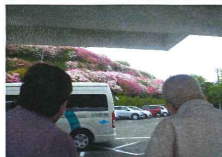
いつまで観ていても飽きませんね!

4月26日と27日に大洲市柚木にある富士山公園に、観に行きました。富士山は西日本有数のつつじ園で、ゴールデンウィーク頃は六万本以上のつつじが咲き、たくさんの観光客が訪れます。満開に咲いたつつじはどの花もきれいに咲いていました。