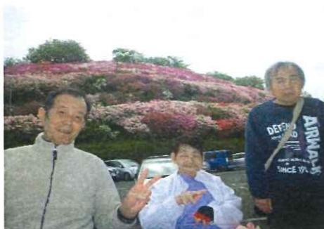
来年も満開のつつじを観に行きましょう