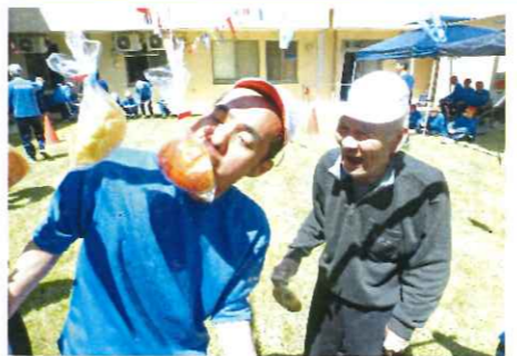
パンくい競争のパンはおいしいな!