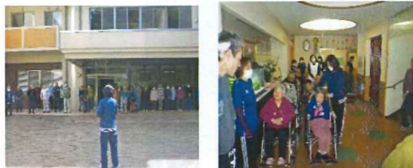
想定時間内で避難が完了しました