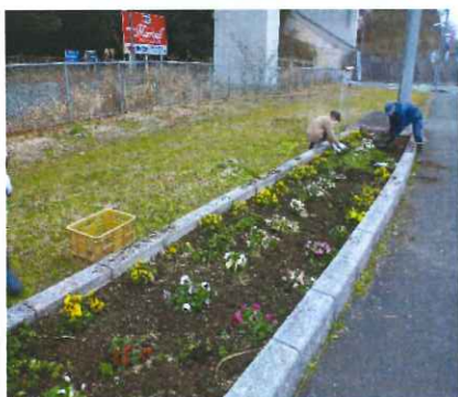
国道56号線沿い(マリエール登り口付近)に花壇があります。是非見に来てください。