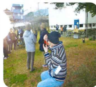
最後に食べる七草粥は格別です(^)/