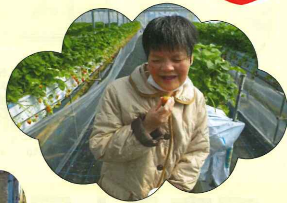
イチゴは別腹です(^)/