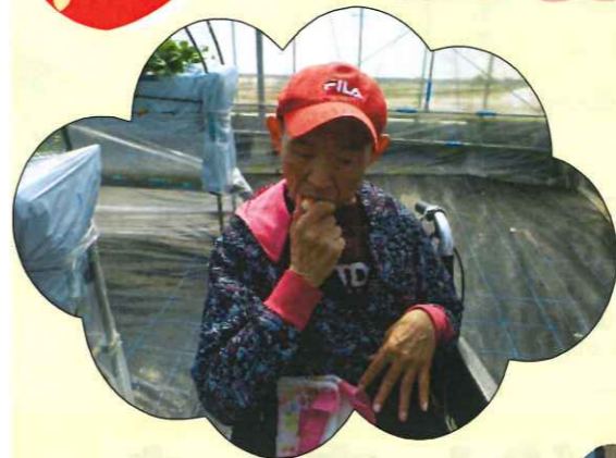
大きいイチゴもしっかり甘いです!