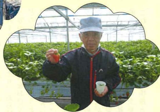
とても美味しいイチゴでした(^_)/v