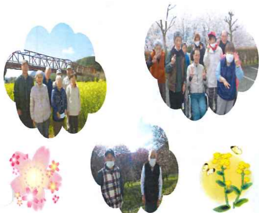
来月も楽しみです(^)/

1月30日(水)から2月4日(月)の間、班活動の時間を利用して梅の花を観賞しに出かけました。富士山の梅の花はとてきれいに咲いていました。4月になると富士山の桜も満開となり、班活動の時間にご利用者さんとドライブに出かけてきました。車窓を楽しんだり桜並木を散策したり皆さん満喫されたようです。今年も幸楽園のしだれ桜は見事に咲きました。車椅子の利用者さんはベッドから横になったまま桜がみえると大変喜ばれていました。