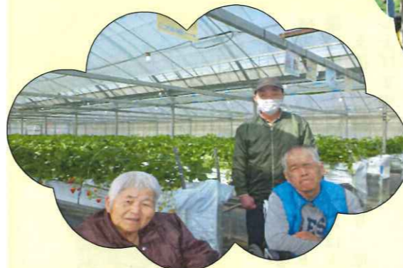
みんなで食べると美味しいね!