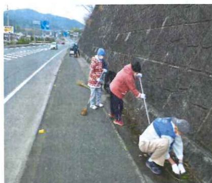
綺麗な街づくりに協力しています

平成30年11月10日(土)、徳島県海部郡にある美波町コミュニティホールでオレンジロード(道路の美化作業)活動の報告を行いました。月に一度の国道の清掃風景や花壇の管理の写真を使って、日ごろの利用者さんの活動の様子を報告しました。