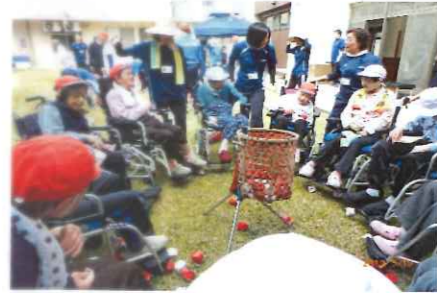
赤組も白組も頑張りました