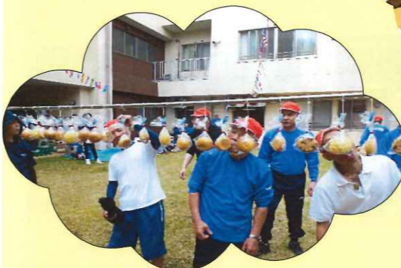
手で取ってはだめですよ(笑)