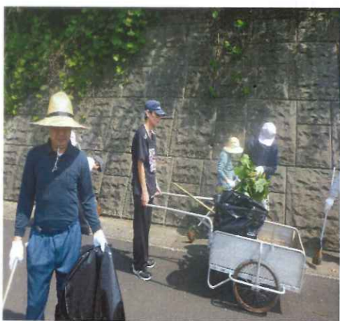
きれいな道作りに一役かっています！

オレンジロードとは南予56号「ボランティア・サポート・プログラム」の愛称で、地域住民や企業団体が主体となり、美化清掃等を行っています。現在オレンジロードの活動は60団体(平成30年4月現在)が活動しています。大洲幸楽園は毎月1回、国道56号線沿北只ショッピング前を中心の清掃と花壇の整備を行っています。現在花壇にはひまわりが咲いています。