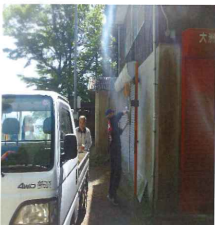
安全運転をお願いします