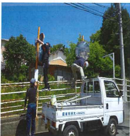
見通しの良いミラーになりました

交通安全週間の5月8日(水)、大洲交通安全協会肱南支部の2名の皆さんのご協力をいただき、高山一帯のカーブミラーを清掃しました。皆さん熱心に掃除されとてもきれいになりました。