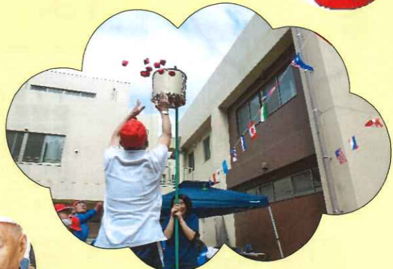
いっぱい玉をいれました！