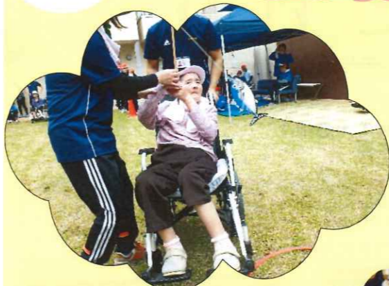
大物を狙いました(´_`)v