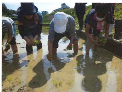
ぬかるみに足を取られて大変でした

6月5日(水)、梅雨の晴れ間に近隣の久米小学校の生徒さんたちと一緒に田植えをしました。とても上手に田植えをされ、「また来て教えてください。」と喜んでいただきました。一生懸命、小学生と一緒に汗をかきました。