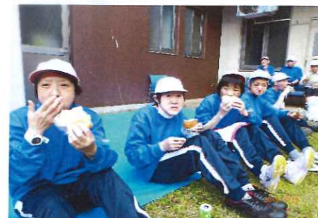
パン食い競争のパンは美味しいな!