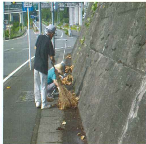
きれいな道作りに一役かかってます!

オレンジロードとは南予56号「ボランテア・サポート・プログラム」の愛称です。地域の人と共に快適な道作りに協力しています。大洲幸楽園は毎月一回、国道56号線沿い(北只シヨツパーズ前を中心)に清掃と花壇の整備を行っています。7月、8月、9月は暑い中清掃活動に取り組みました。