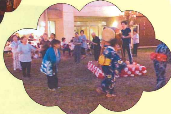
最後は盆踊りを踊ります