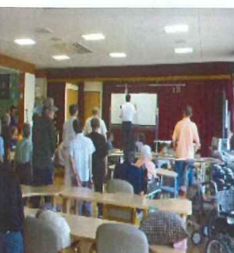
園長さんより地震についてのお話がありました