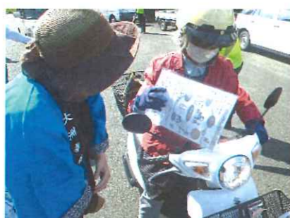
安全運転でよろしくお祈りします(^_^)/

9月25日(水)に、大洲市平野の県道沿い(四国通建(佛前))で、地域貢献活動の一環として交通茶屋を開催しました。 秋晴れの絶好の天気のもと、今年で7回目になる交通茶屋は、大洲警察署及び大洲交通安全協会、大洲支部・平野支部の皆様のご協力のもと実施することができました。 通行する車一台、一台に止まっていたいただき、施設の利用者さんが交通安全の啓発グッズと大洲の特産物である梨を配り安全運転をお願いしました。