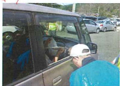
沢山の人たちにご協力いただきました