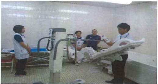
実際に職員が乗ってみました