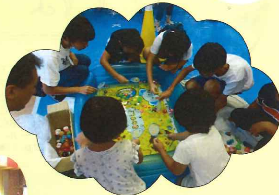
地域の人にたくさん来ていただきました