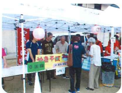
やきそば150食完売です！(。^_^)ノ