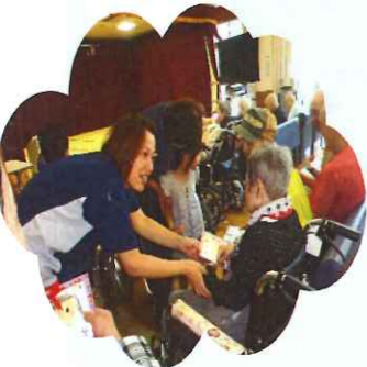
似顔絵入りのプレゼントを頂きました