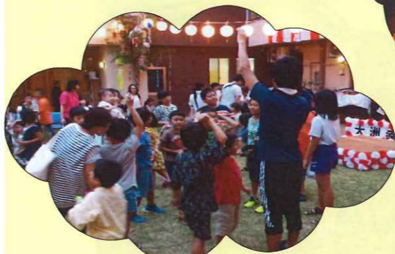
子どものイベントもたくさんあります