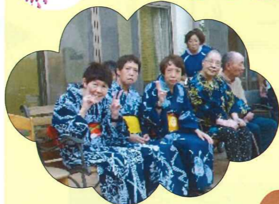
地域の人たちの歌声に聞きほれます