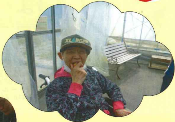
いちごは別腹です(^_^)/