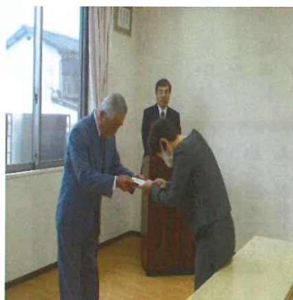
今日まで本当にお疲れ様でした