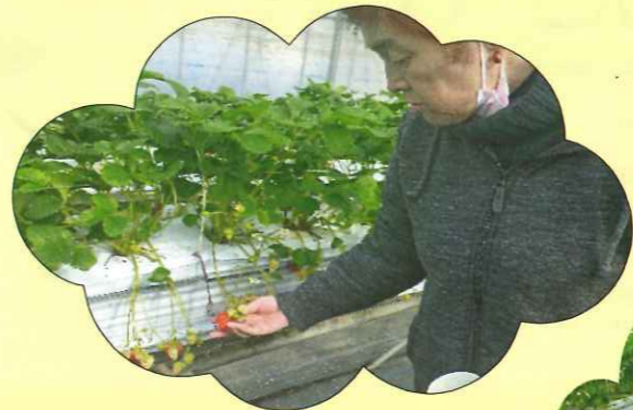
どのいちごが美味しそうかな！