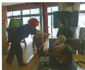
鬼は外! 福は内! (*~*~*)