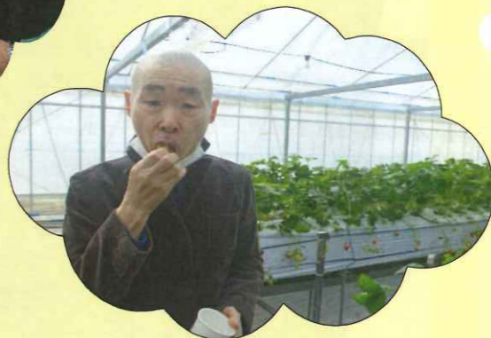
とても美味しいいちごでした(^_^)v