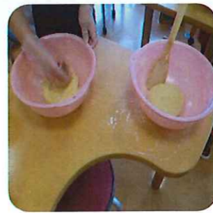
焼きあがりを楽しみます(≥▽≤)