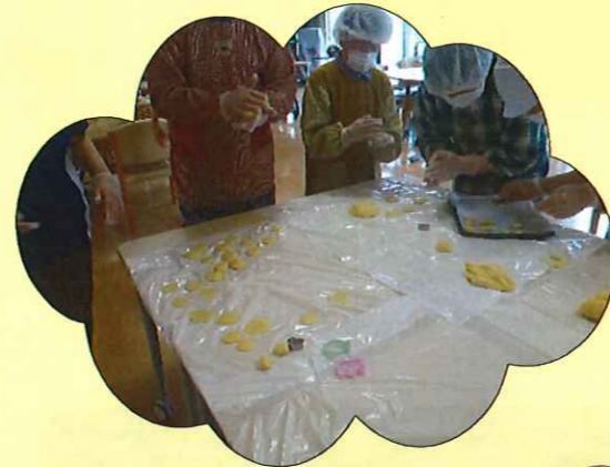
どんな形にしようかな(^_^)v