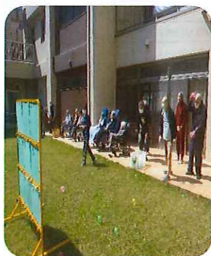
的に当てるのは難しいな(・▽・)