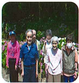
花を見ると心が癒されます