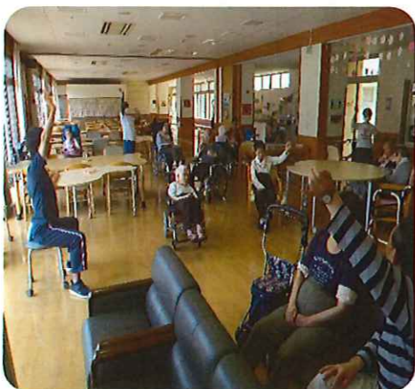
手をしっかり伸ばします!

今月も新型コロナウイルスの影響で外出できない日々が続いている為、体力低下を防ぐ為、屋内でできる体操をしっかりと行いました。毎日のラジオ体操と機能訓練に加えて、懐かしい歌謡曲に合わせたリズム体操や、中国拳法を参考にした太極拳体操など行っています。リズム体操は皆元気に楽しく体を動かし、太極拳は慣れない動きに戸惑いながらも頑張る姿が印象的でした。これからも暑さやウイルスに負けないようしっかりと体を動かしていきます。