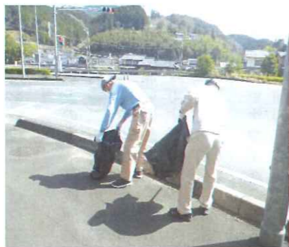
綺麗な街づくりに協力しています

一月はコロナウイルス対応にて中止していましたが、二月、三月と実施し、花壇から高架下までの清掃を行いました。枯葉がたくさんあり、集めるのに時間はかかりましたが、みなさん熱心に掃除をされていました。