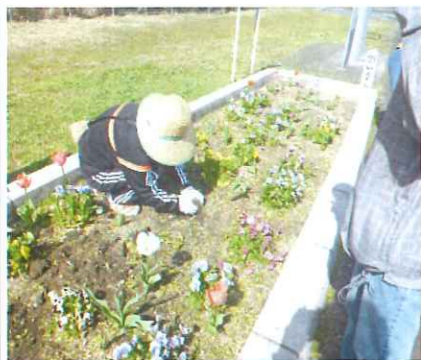
国道56号線沿い（マリエール登り口付近）に花壇があります。是非見に来てください。