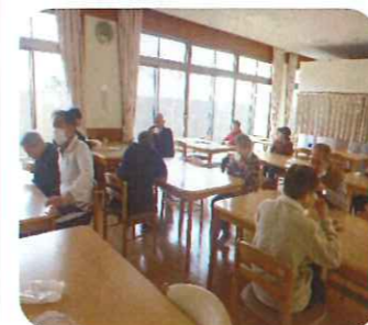
温かい甘酒たくさん飲みたいな♪