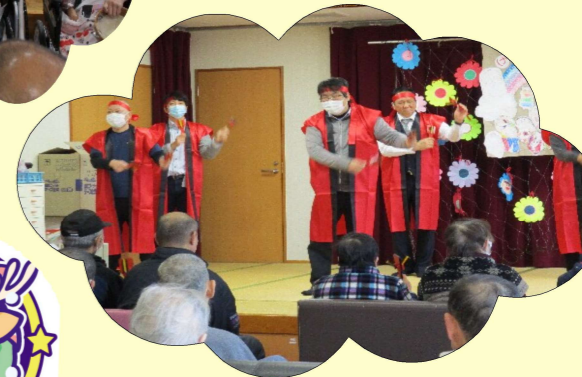
みんなでよさこい踊り(^_^)v