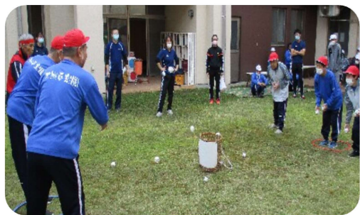
かんたんって言うけど難しいぞ