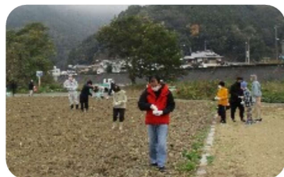
綺麗な花が咲きますように