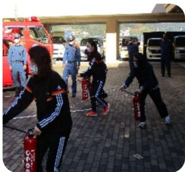
狙いを定めて消化します