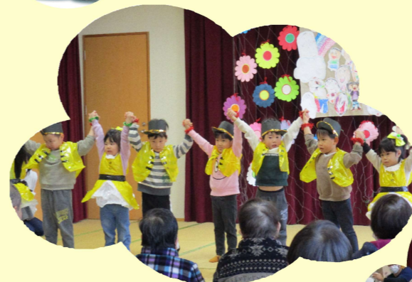
園児の皆さんに来園していただきました！