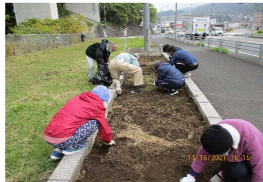
国道56号線沿（マリエール登り口付近）に花壇があります。是非見に来てください。

新年あけましておめでとうございます。皆様にかかれましては、穏やかに令和四年をお迎えにられましたこと、心よりお慶び申し上げます。 昨年は、前年から続く新型コロナ禍の中で、緊張感も薄れつつあったのも事実。しかし、昨年暮れから再び得体のしれない変異株、オミクロン株による感染の急拡大により、自粛生活を余儀なくされそうな心配です。大洲幸楽園職員の皆さんには、ここ二年間で培った感染防止策の経験を継続して、感染者ゼロのまま収束することを願っています。 福祉施設のイメージとして一般的に「善意」「優しさ」「愛」等で見られがちですが、介護現場の日常においては、そんなきれいごとの言葉では語れない現実があります。ただ、介護に携わるすべての人の根っこには、「善意」「優しさ」「愛」が輝いていることでしょうか。人を思うという心がない限り成立しない介護の現場…。利用者皆さんの命に寄り添い、暮らしを守る誇りを胸に、新年をスタートしてください。 利用者の皆さんに笑顔の多い一年となることを願って、年頭のご挨拶と致します。