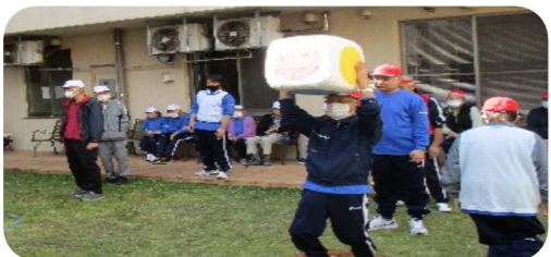
どこまで飛ばせるかな