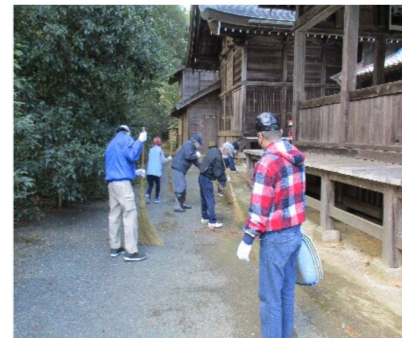
境内もきれいになりました！！