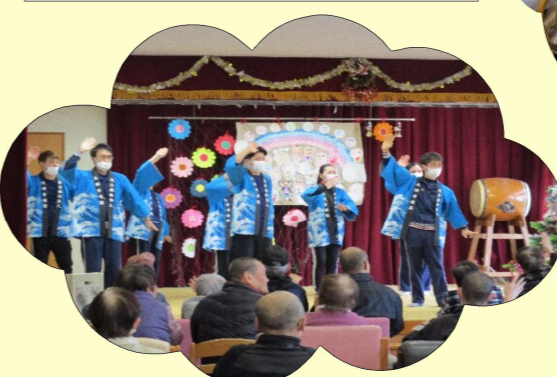
東京音頭踊りました☆彡