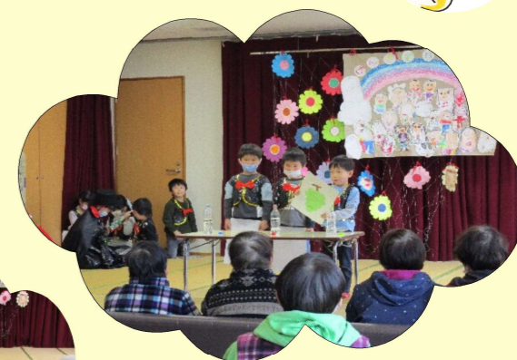
園児がマジックをしてくれました(^_^)/