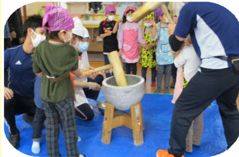
上手にお餅をつく事ができました!(^^)!

12月23日(木)、食堂で餅つき大会を行いました。今年は大洲乳児保育所の園児にも参加していただき一緒に餅をついたりする機会もありました。初めて餅つきを見たという園児もいて、とてもいい経験になりました。また、お餅はおやつの時間にいただきました。