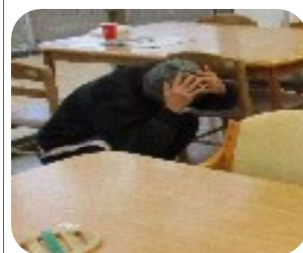
体制を低くして安全を確保