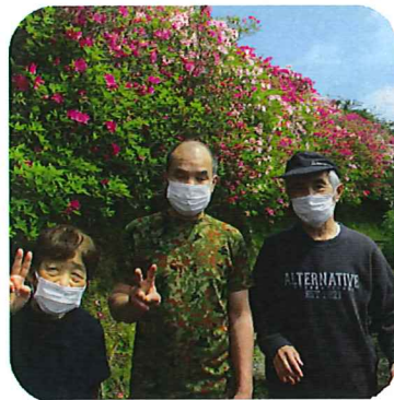
どこも満開でした。