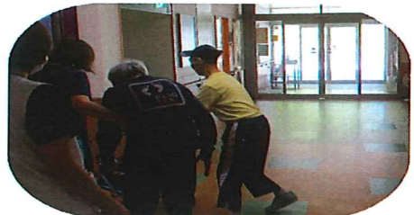
垂直避難を行います。