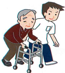
自分の運動能力を精一杯引き出します

大洲幸楽園では、定期的に理学療法士に訪問してもらい、利用者の運動機能訓練の指導をしてもらっています。それぞれの利用者の身体機能を見極め、無理のない範囲で、毎日行える運動を提案してもらいます。皆自分の能力を最大限生かして、一生懸命運動していました。