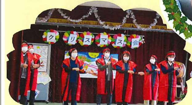
よさこい踊りを披露しました。