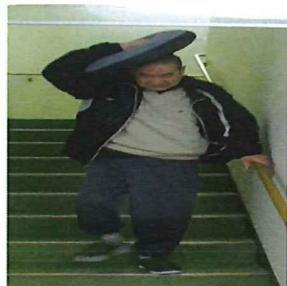
落ち着いて安全に避難します