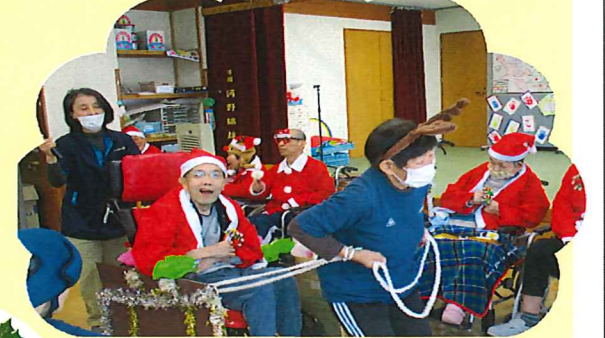
トナカイにひかれてサンタさんがやってきました(o^o)