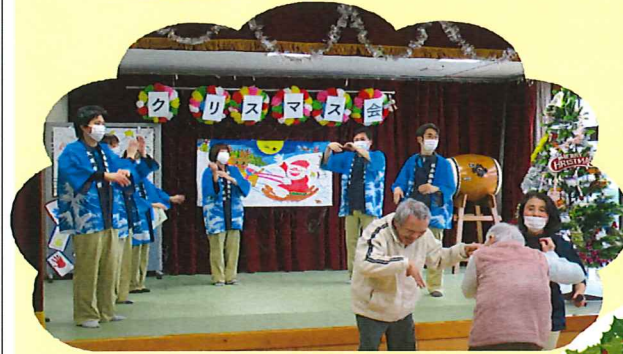
みんなも一緒に東京音頭