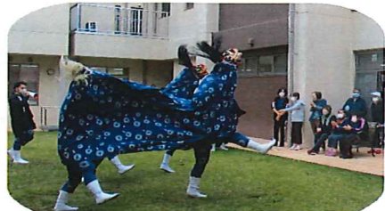
間近で見ると迫力あります。

11月2日〜3日は大洲市の秋祭り。大洲幸楽園にも獅子舞が来てくれました。中庭に来て、目の前で獅子舞に舞ってもらい、利用者さんたちは大喜びです。舞った後は順番に頭に噛みついてもらい、邪気を祓ってもらいました。今年も健康に過ごせると良いですね。