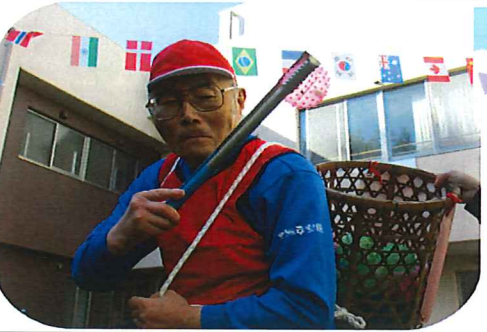
玉拾いはお任せ下さい(´д`´)キッ

10月20日(木)中庭で運動会を実施しました。昨年に引き続き今年も大洲市障がい者スポーツの集いの競技も同時に開催しました。お玉でボールを落とさず運ぶ「ゆつくり急いで」、バットでボールを転がす「ゴルフ競争」、さいころの出た目で走る距離が決まる「信号ゲーム」等工夫を凝らした競技に、利用者さんたちは、悪戦苦闘しながらも、笑顔で楽しんでいました。