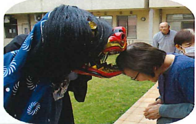
獅子舞に邪気を祓ってもらいます