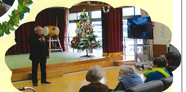
円熟の歌声を聞かせてもらいました。