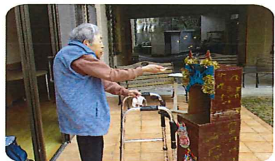
鬼さん一緒に豆食べようか。