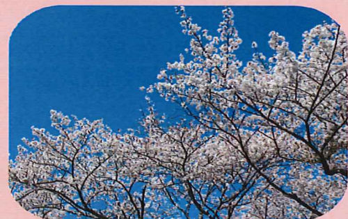
青空の下満開でした。

今年の寒さも厳しかったですが、寒さが和らいできたと思つたらあつという間にキレイな花に囲まれる季節になりました。幸楽園でも皆で富士山の桜と五郎の菜の花を見に行きました。どちらも今が盛りと咲き誇っていて、花の下で皆自然と笑顔になっていました。五郎の菜の花は花の中の小道に入つて菜の花に囲まれるような写真が取れました。富士山では、青空の下桜に囲まれた遊歩道を皆で歩きました。どちらも皆の心に残るドライブになったと思います。