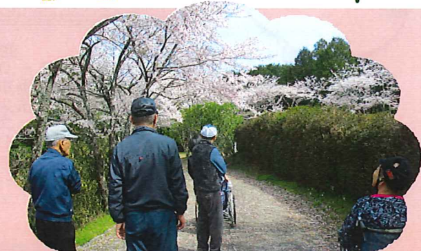
皆で桜の小道を歩きます。