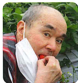
いちご甘くて大きい