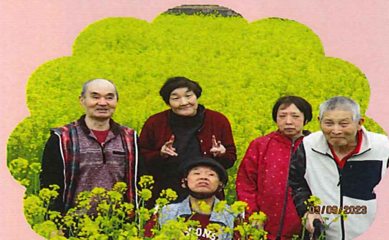
菜の花につつまれてピース