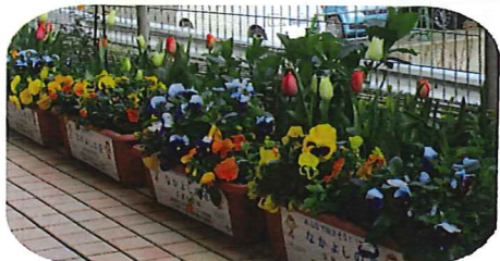
元気に花を咲かせています。