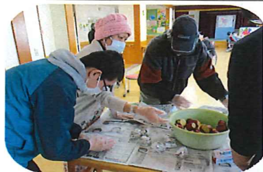
美味しいお芋の為に頑張ります