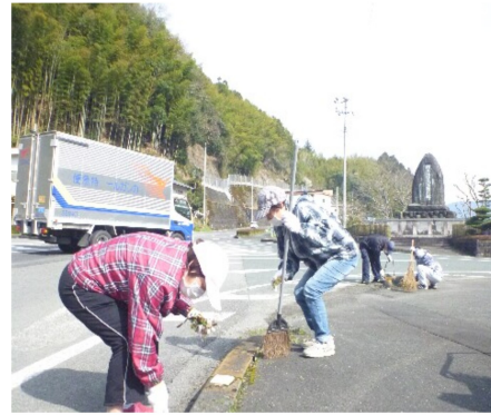
国道56号線沿い(マリエール大洲登り口付近)に花壇があります。是非見に来てください。

オレンジロードとは南予56号「ボランティア・サポート・プログラム」の愛称です。地域の人と共に快適な道作りに協力しています。大洲幸楽園は毎月1回、国道56号線沿(北只ショッピング前)を中心に清掃と花壇の整備を行っています。去年の12月22日に植えたチューリップが見ごろになってます。近くを通られた際はご覧ください。