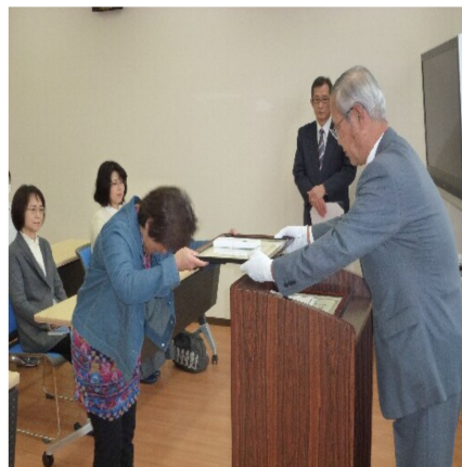
今日まで本当にご苦勞様でした