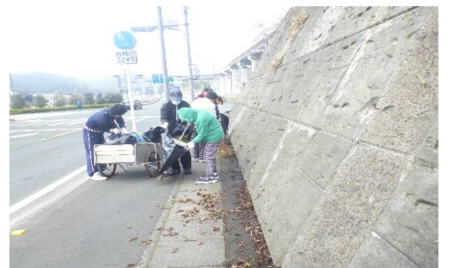
きれいな道作りに貢献しています