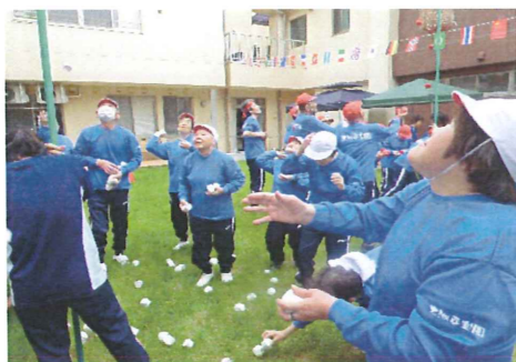
赤組も白組も頑張りました