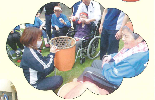
いっぱい玉をいれました!