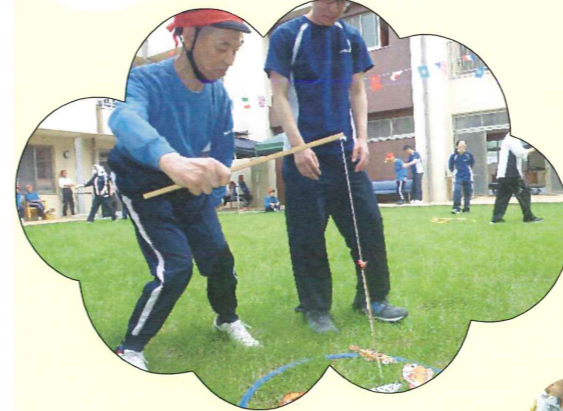
大物を狙いました(´_`)v