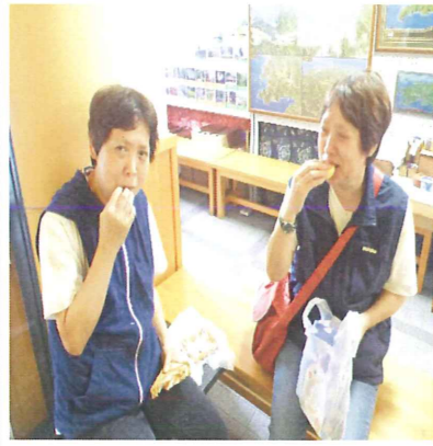
近くのどんぶり館にも寄りました!

6月21日から4班に分かれて、宇和町の観音水にあるソーマン流しに行きました。雨の日に重なることもありましたが、梅雨の蒸し暑さを少しでも和らげることができました。7月にもソーマン流し遠足を予定しています。