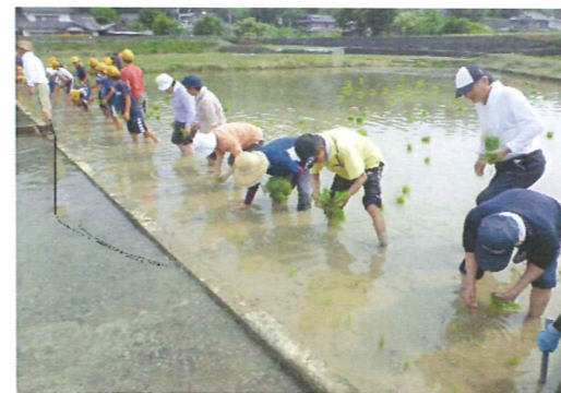
ぬかるみに足を取られて大変でした