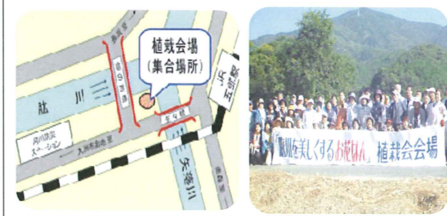
JR五郎駅の近くです!ぜひ見に来てください!

平成15年度から「肱川をきれいにするお花はん」として始まった植栽会も今年で14年目になります。今年も大洲市の象徴の肱川をきれいにするために、植栽会に参加してきました。ひまわりがきれいに咲くように一生懸命種をまきました。