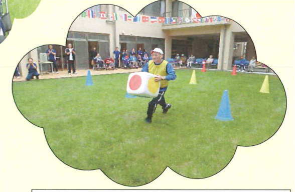
うっかり!サイコロを持って走ってます!