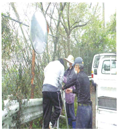
安全運転をお願いします