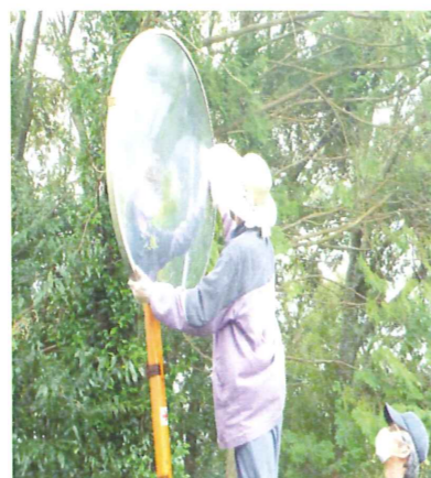
見通しの良いミラーになりました