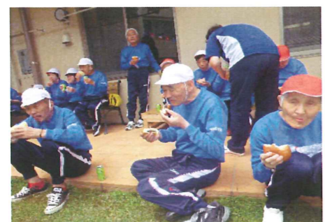
パンくい競争のパンはおいしいな!

5月15日、大洲幸楽園の中庭で運動会を行いました。心配された天気も、晴天に恵まれての開催です。ケガの無いように十分にラジオ体操を行って、初めに行うプログラムの玉入れです。両組ともたくさん玉を入れましたが、赤組の方が多く、今年も赤組に軍配が上がりました。 その後も、栗拾いゲームや、魚釣りゲームやパン食い競争など、おもいっきり体を動かしました。