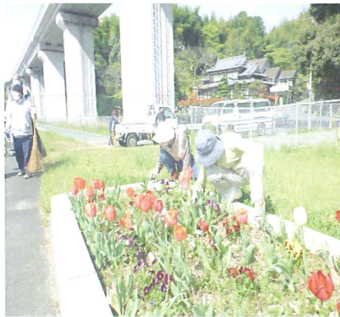
きれいな道作りに一役かっています!

オレンジロードとは南予56号「ボラソニア・サポート・プログラム」の愛称です。地域の人と共に快適な道作りに協力しています。大洲幸楽園は毎月1回、国道56号線沿(北只シヨップ・パーク前を中心)に清掃と花壇の整備を行っています。現在花壇にはひまわりの芽が顔を出し始めました。