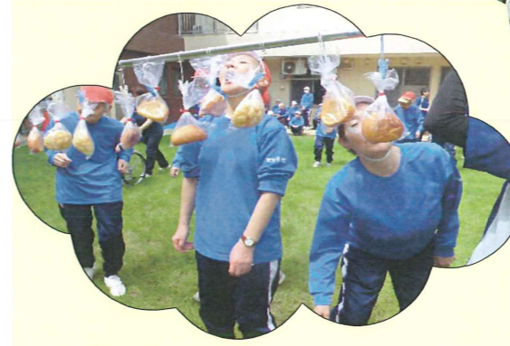
手で取ってはだめですよ(笑)