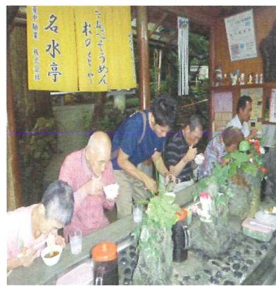
皆さんも是非お出かけください!