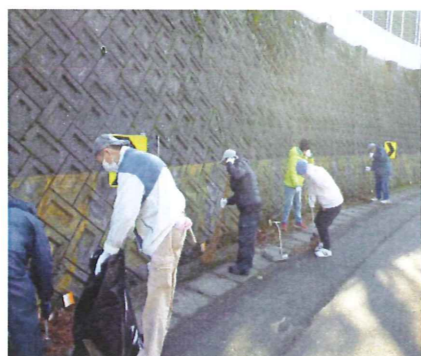
綺麗な街づくりに協力しています