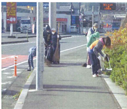
国道56号線沿い（マリエール登り口付近）に花壇があります。是非見に来てください。