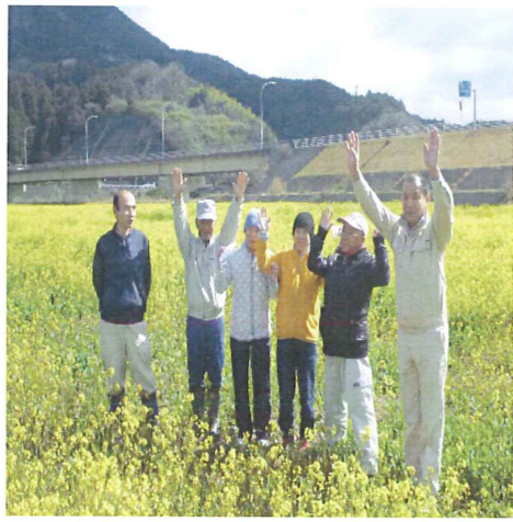
夏はひまわりが咲きます(^)/