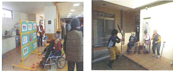
健康に過ごせますように・・・(*_*)