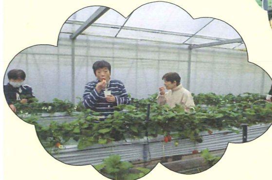
みんなで食べるとおいしいね！