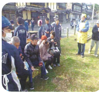
最後に食べる七草粥は格別です(^)/