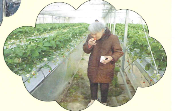
とても美味しいいちごでした(^_*)v