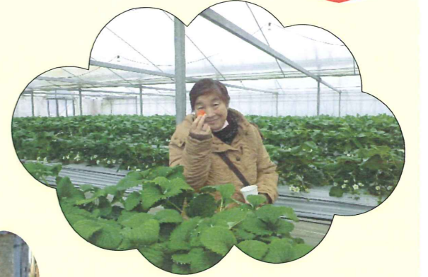
いちごは別腹です(^)/