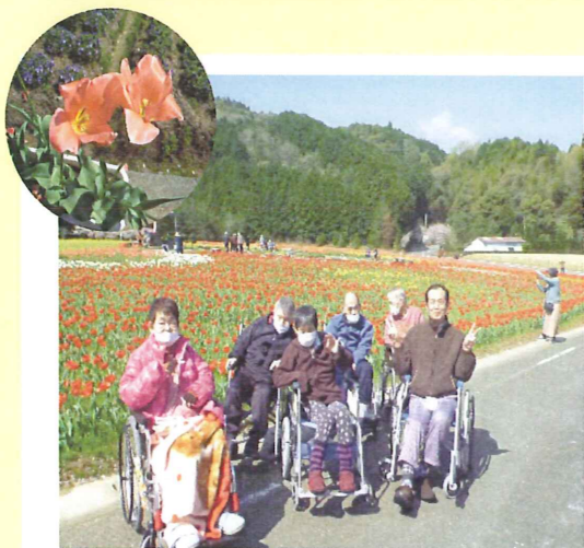
天気もよくて最高でした

長く居座っていた雲が抜けた4月13日、大洲市西大洲のフラワーパークおおずで、約4万5千本のチューリップが満開となり、早速鑑賞に出かけました。赤色や黄色や白色など色鮮やかなチューリップがとても綺麗でした。「最初は見に行こうか迷っていたけど、見に行つて本当によかった」と利用者さんも大変感動されていました。来年もぜひ見に行きたいと思っています。