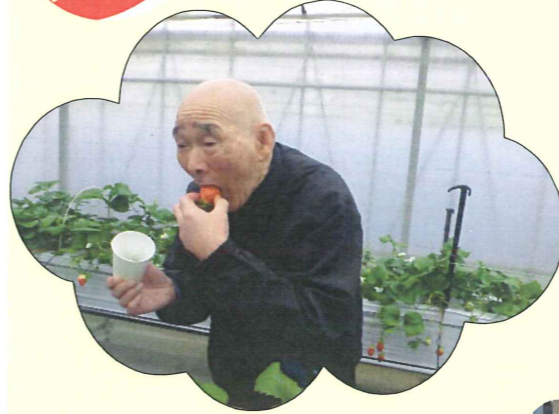
大きいいちごもしっかり甘いです！