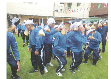
昨年の運動会の様子です(^)/