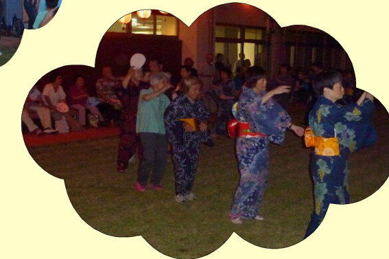
最後は盆踊りを踊ります！