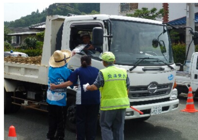
沢山の人たちにご協力いただきました