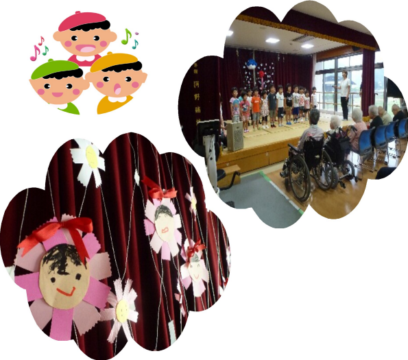
似顔絵入りのプレゼントを頂きました。

8月2日大洲警察署の生活安全課の職員さんをお迎えして防犯・不審者対応講習会を行いました。 警察署の職員の方に犯人役になっていただいてロールプレイングをしました。色々な手段で施設に入ろうとする犯人役から利用者の安全を守るために考えていく中でたくさん課題や問題がでてきました。 この講習会で学んだことを活かして、利用者の安全管理の徹底に努めていきます。