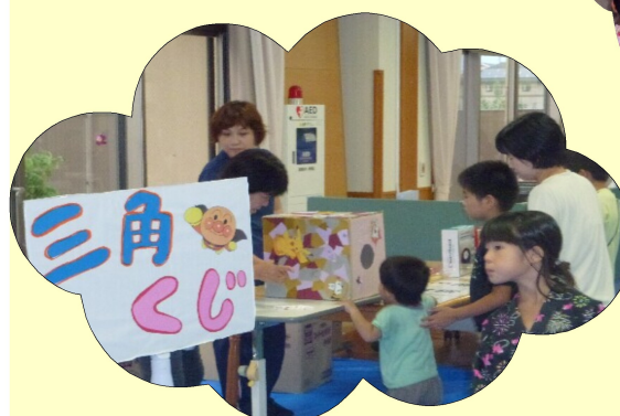
子どものイベントもたくさんあります