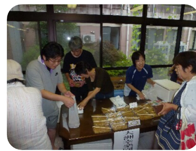
やきそば111食完売です、(^.^)/

8月5日に大洲育成園で実施される「桃太郎工房夏祭り」にやきそばを出店しました。 今年は雨が降ってしまつたので室内での販売でした。雨にもかかわらずたくさんの方で用意していた111食のやきそばは1時間ほどで完売しました。 大洲幸楽園の納涼大会では育成園の皆さんにはパンを販売していただきました。来年も他施設との交流のためにも、是非参加させていただきます。