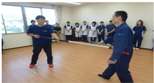
さすまたの使い方も習いました。