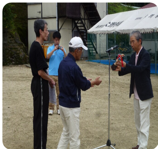
利用者さんの活躍で準優勝(^_^)/

9月23日に大洲学園グラウンドで、ソフトボール大会が行われました。 この大会は、ソフトボールを通じて相互の親睦を図り、障がい者の自立更生や生活向上を促し、市民の障がい者に対する正しい理解を深めることを目的に、大洲市障がい者連絡協議会主催のもと、毎年開催しております。 当日は晴天で、大洲幸楽園からは選抜された5名の利用者と職員4名が参加しました。 1、2回戦は順当に勝ち、決勝戦は去年、一昨年と負けている大洲学園に挑みましたが、1対5で力負けしました。来年はもっと練習して優勝できるように頑張ります。