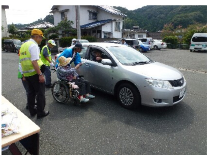
安全運転でよろしくお願いします(^_^)/