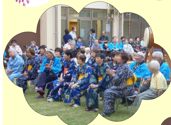
地域の人たちの歌声に聞きほれます