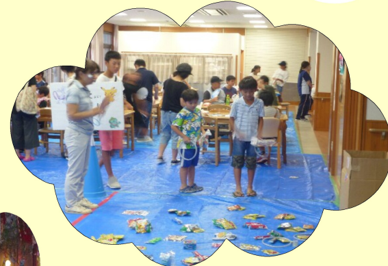
地域の人にたくさん来ていただきました！