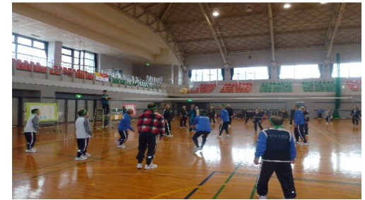
最後のバレー盛り上がりました！

11月7日、大洲市総合体育館のアリーナ全面を使用して、愛媛県下の救護施設四施設が集まり運動会を実施しました。毎年、他施設との交流のために行っています。日ごろの運動不足もありましたが、玉入れや、風船割り競争などに一生懸命参加しました。今年初めての種目のバレーは一回戦、みさか荘との対戦になりましたが、負けてしまいました。3位決定戦では寿楽荘と対戦して、見事勝つことができました。来年は練習して優勝したいです。