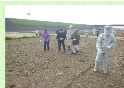
菜の花の種をまきました(´_`)v

あけましておめでとございます。あつという間に一年が過ぎて、新しい年を迎えました。先日、利用者さんと一緒に恒例の七草粥歩こう会に参加してきました。歩き終わった後、七草粥を食べながら無病息災を祈願しました。