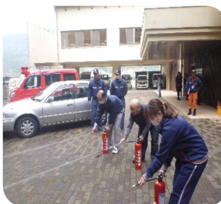
利用者の安全を守るために講習を受けました