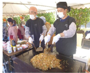
幸楽園のやきそばは大人気！