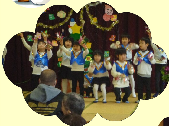
園児のみなさんに来園していただきました