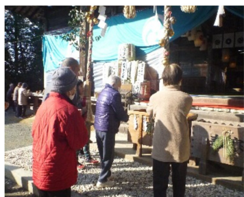
健康で過ごせますように・・・

1月1日と3日に大洲市阿蔵にある、八幡神社に初詣に行きました。両日とも天気良かったです。せいか、たくさんの方々が詣でていました。利用者みなさんは、今年一年の健康を願い、手を合わせておられました。