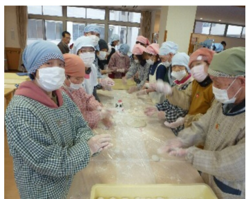
上手にまるめることができました

12月26日に大洲幸楽園の食堂にてもちつき大会を行いました。女性や車椅子の利用者も杵を持ってもちつきに参加しました。利用者のみなさんは「いつ正月がきてもいい。」と言いつつ、ひとひとつひとつ丁寧におもちを丸めました。ぜんざいもとても美味しかったです。