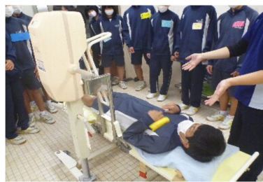
車椅子などに乗って福祉施設を体感

11月14日に大洲市立大洲南中学校の生徒20名が来園して、福祉体験を行いました。中学校授業の一環の体験で、車椅子や、特浴器具等を体験していただき、身体に障がいのある方の気持ちに近づいていただきました。利用者と一緒に様々な活動を通して、福祉に対する理解を深めていただきました。