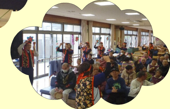
みんなでよさこい踊り(^_^)v

12月20日に大洲幸楽園の食堂でクリスマス会を開催しました。クリスマス会は納涼大会に続く大洲幸楽園の一大イベントです。各課が試行錯誤しながら出し物を発表します。まず、総務課がハンドベルの演奏を行いました。次に大洲乳児保育所の園児のみなさんに来園していただき踊りや歌を披露していただきました。次に看護課の出し物でよさこい踊りを披露して、最後に支援課による寸劇と足あてクイズを行いました。午後からはみんなでクリスマスケーキを食べました。今回のクリスマス会も利用者さんが喜んでいただけよう盛り上げていきたいと思えます。