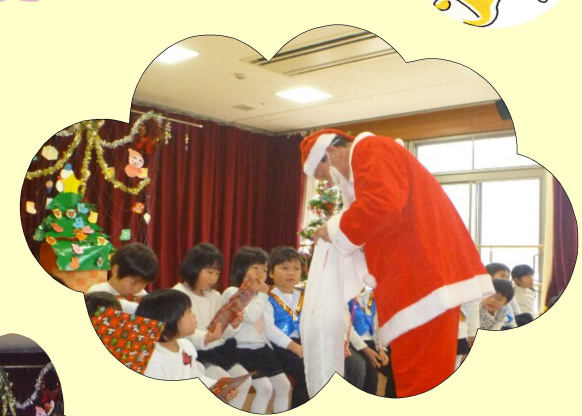
サンタがやってきたよ(^_^)/