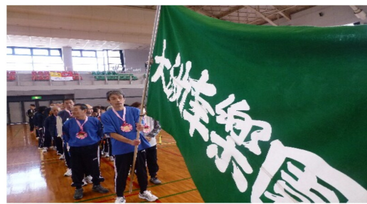
四施設の利用者さんが勢ぞろいしました！