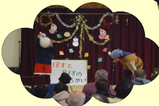
支援課職員による寸劇は好評です！