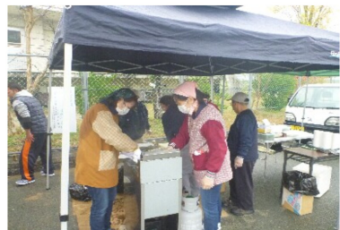
からあげ大盛りで200円！！

11月26日に久米ふるさとまつりでからあげを販売しました。あいにくの雨で寒い一日でしたが、現地で揚げたからあげは好評で昼過ぎには用意していた120食を完売することができました。